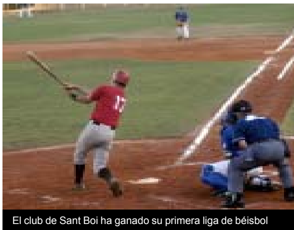
El club de Sant Boi ha ganado su primera liga de béisbol